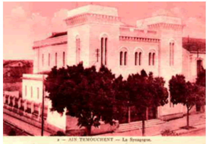
Early 20th C. French postcard of the main synagogue at Ain Temouchent, Algeria

Abstract: This dissertation explores the modern history of the Jewish community of Algeria by placing it in the context of a colonial triangle, which is formed by the French colonial power, the Algerian Jews, and the Algerian Muslims. Within the framework of those tumultuous trilateral relations, the objective is to demonstrate the great difficulties with which the Jews of Algeria attempted to maintain a balance between their historical affinities with the Muslims and their political allegiance to the French nation. Such a complex balance was further complicated by the emergence of a violent French anti-Semitic movement and the advent of a Muslim-led nationalism, both of which threatened the interests of the Jewish community of Algeria. Similarly, issues such as Nazism and Zionism also constitute