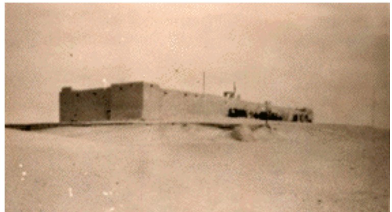
Fort Grosdemange & PTT, Arawan, 1926